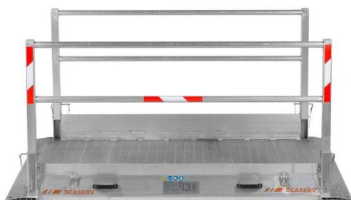
Lávka so zabezpečeným zábradlím pripravená na použitie