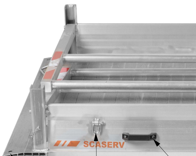
Závesné oko na prepravu žeriavom Madlo na jednoduché prenášanie Poistný otvor proti posunu